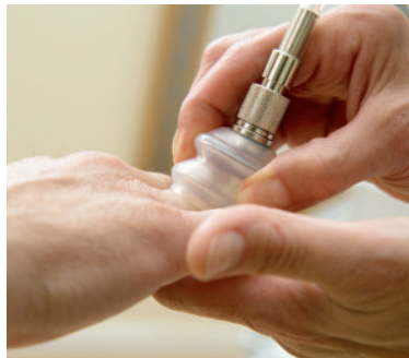
Behandlung der kleinen Gelenke