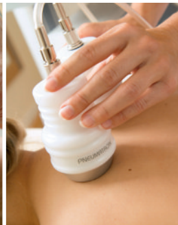
Thermobehandlung bei Rückenproblemen