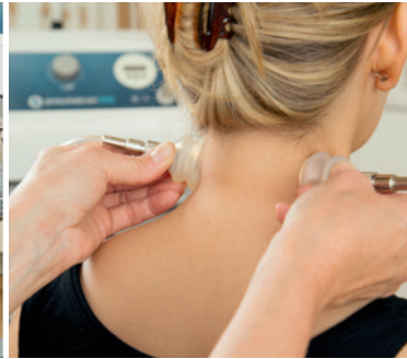
Behandlung bei Migräne und Nackenschmerzen